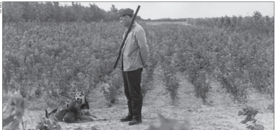
W szkółce zadrzewieniowej rosły sadzonki jesionu, kasztanowca, klonu, karagandy, jarzębiny białej, akacji i dzikiej róży.