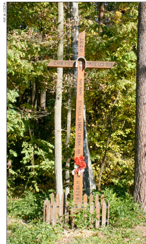
Krzyż na terenie leśnictwa Romanów (Nadleśnictwo Włodawa) postawiony przez straż leśną w 1929 r.